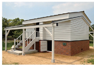
倉敷天文台 倉敷市中央 2-19-10 ☎086(422)0001 ◆天体観望(日没後約2時間)は、要事前予約 ◆「原澄治・本田實記念館」の開館時間は、月・水・金(祝日を除く)の13:00~17:00

岡山は天体観測に最適な地、天文台をめぐり、日本初・庶民の天文台 倉敷天文台 岡山は天体観測に最適な地、天文台をめぐり、日本初・庶民の天文台 倉敷天文台 岡山は天体観測に最適な地、天文台をめぐり、日本初・庶民の天文台 倉敷天文台